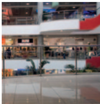
lépcsőházban és átjáróban