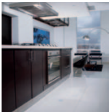
konyhában és mosókonyhában