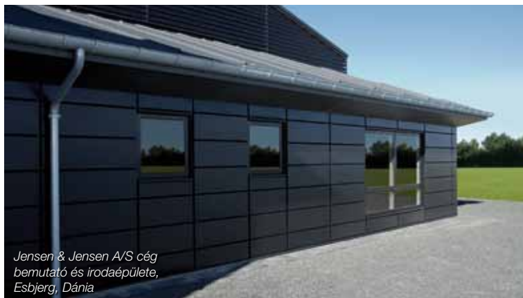
Jensen & Jensen A/S cég bemutató és irodaépülete, Esbjerg, Dánia

Az acél falkazetták külső felületére különböző fajtájú és színű bevonatok kerülnek. Az ECO falkazetták a standard 25µm vastag poliészter bevonattal 5 féle kedvelt színben (fehér, ezüst, sötétkék, sötétszürke, bézs) állnak rendelkezésre. Az új fejlesztésű PREMIUM falkazetták kétféle bevonattal készülnek: a 20µm PVDF bevonatot 4 alapszínben (fehér, fekete, ezüst, antracit metál); míg a speciális porszórásos technológiával felvitt fedőfestéket bármilyen RAL/NCS színkóddal megadva biztosítani tudjuk.