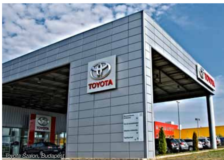
Toyota Szalon, Budapest

különböző szélességi és magassági méretekben, többféle bevonat és szín közül választható ki az épülethez és a vevői igényekhez legjobban illeszkedő kazettás burkolat. A kazettákkal együtt az egyedi sarokmegoldások és illesztések adják meg a termék tökéletes homlokzati összhangját.