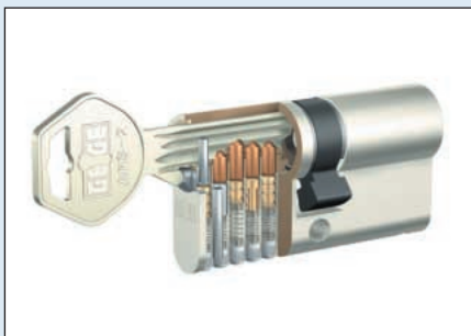
Fokozott védelem a nyitási manipulációkkal szemben.