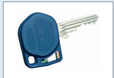
A Gege ANS2 kulcsok utólag is elláthatók Legic® jeladóval mechatronikus rendszerekhez.

Kaba Elzett Zrt. 1550 Budapest, Pf.: 198 Tel: +36 1 350 1011 Fax: +36 1 329 0692 E-mail: info@elzett.hu